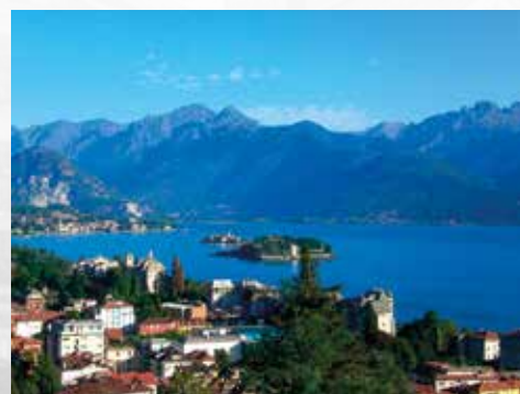
Veduta delle Isole da Stresa