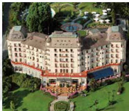
Regina Palace Hotel, Stresa