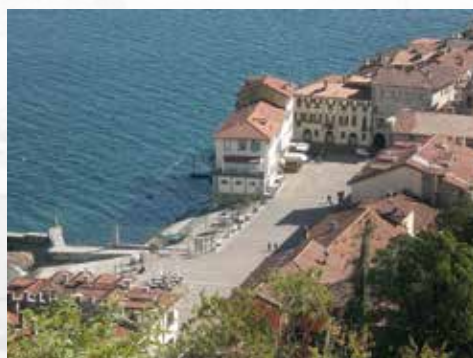
Piazza del Popolo - Arona