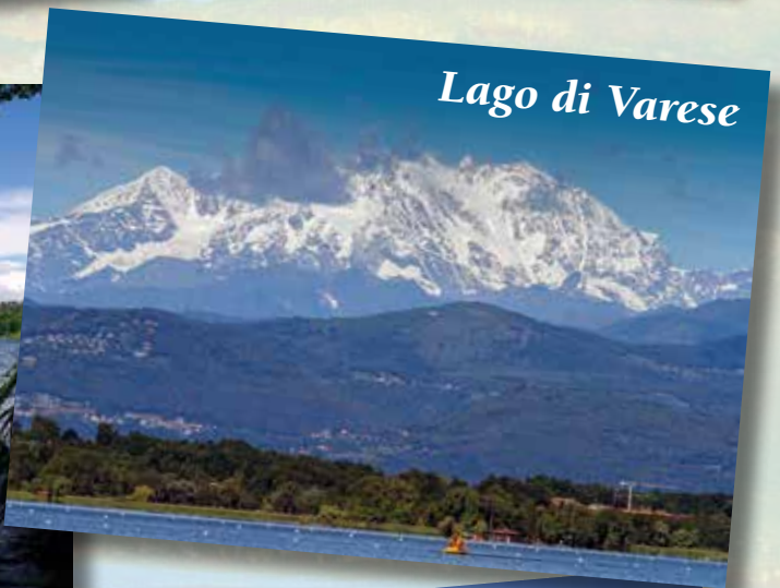
Lago di Varese